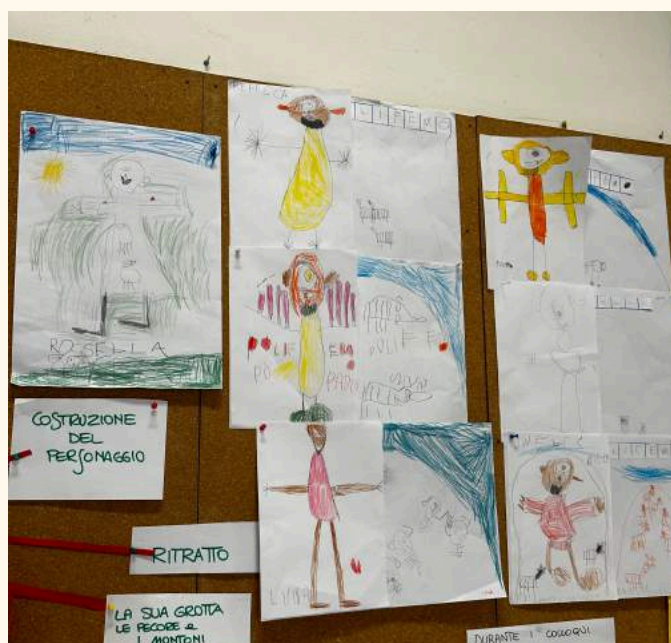
LABORATORIO GRAFICO: DISEGNA IL MONDO DEL LIBRO