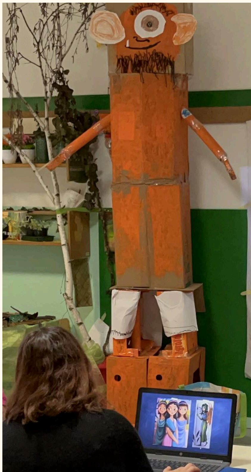
I "BURATTONI": IL CICLOPE POLIFEMO